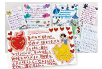
母と娘の心を繋いだホメカ(褒めカード)

娘が塾からすぐ喜んで帰ってくる“ホメカ”を家でも実践して、更にデコレーションを加えて頑張ったことを褒めるカードを娘に渡しました。